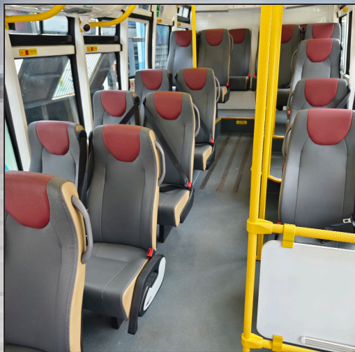
可以改配置斜台, 供一輪椅上落